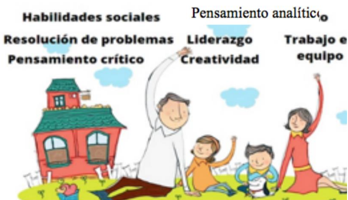
Ilustración 1.

En la imagen puedes observar algunas competencias para la vida, la palabra algunas esta mostrando que existen muchas más competencias, complementa el dibujo con otras tres competencias para la vida. por ejemplo yo le anexé el pensamiento analítico.